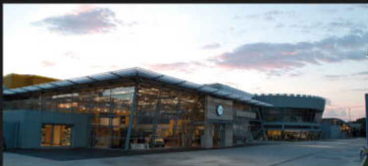
In questa pagina, progetto di showroom Audi e Volkswagen realizzato dall'Arch. Roberto Bellotti per l'ex Studio CBCR. In basso, corpo di collegamento tra le due esposizioni adibito a spazio per eventi ed uffici. In alta a destra, interno di un negozio di abbigliamento a Milano.

de attenzione al riuso e alla riqualificazione di singole unità immobiliare o di interi immobili, sia a destinazione residenziale che terziaria o produttiva. Gli interni sono sempre molto curati. Particolare importanza riserviamo inoltre al progetto d'illuminazione di edifici, aree, o spazi interni poiché la luce riveste secondo noi una enorme valenza nel risultato finale del progetto nel suo complesso».